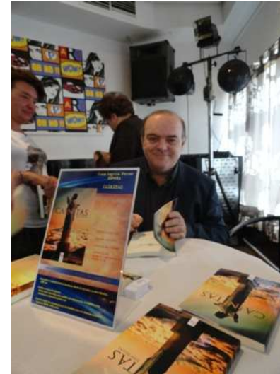
Firma de libros en el acto de presentación en el bar Pikeras de Azuara (Zaragoza).