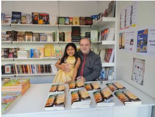
Firmando libros en el stand de Mira Editores, en la Feria del Libro de Zaragoza.