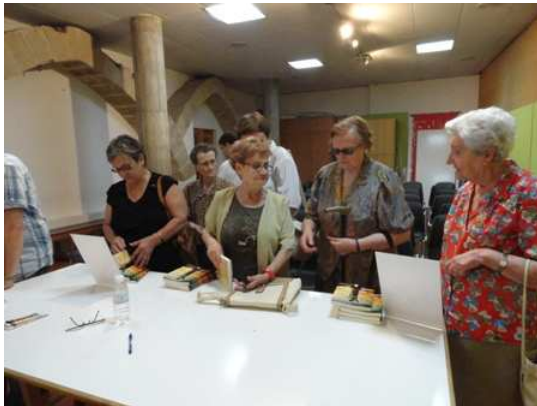
Terminado el acto de presentación, adquisición de ejemplares por parte de los asistentes en el salón "Galilea".