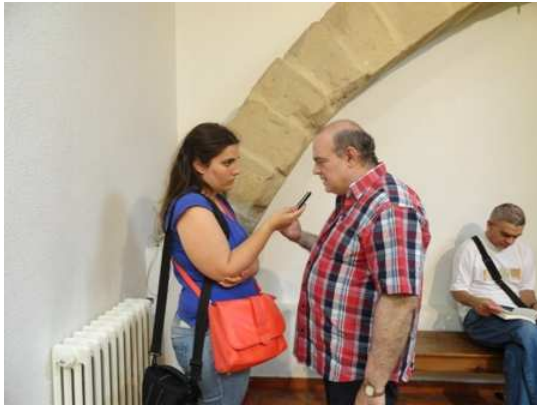
Haciendo una entrevista para Radio La Comarca, en el salón Galilea de la Casa Parroquial, donde se celebró el acto.