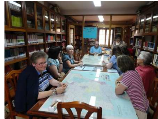
Tertulia literaria en la Biblioteca Municipal de la ciudad del Compromiso, el día 20 de junio de 2014.