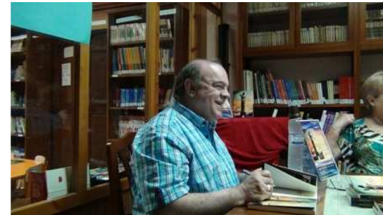
Firma de ejemplares en Caspe, el 20 de junio de 2014. Biblioteca Municipal.